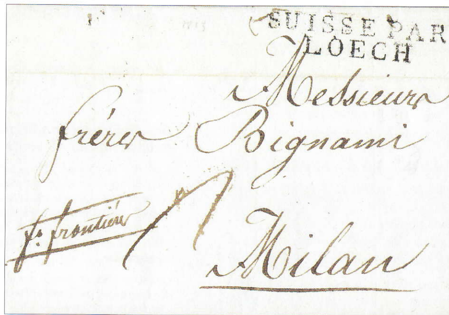
Cette lettre est partie de Berne le 4 février 1813 pour arriver à Milan le 9 février 1813. (Voir commentaires en pages 5 et 6)

Organe des Clubs d'Aigle, de Brigue, de Martigny, de Monthey, du Pays d'Enhaut, de Sierre, de Sion, de Vevey