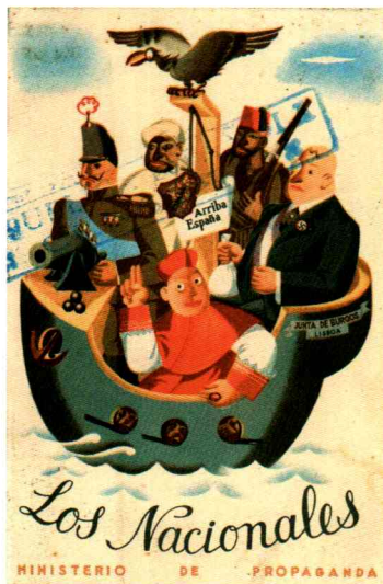
Affiche de propagande politique, Juan Antonio Morales, vers 1936. Pavelló de la República (UB) Marque de censure militaire républicaine de Barcelone (RB3.12a; de 6.197 à 1.1939)

L'histoire de cette émission débute à l'été 1938 lorsque la République est mortellement blessée après l'échec de l'offensive de l'Èbre. Malgré cette situation catastrophique, la stratégie du gouvernement républicain de Juan Negrín s'est concentrée sur la prolongation de la résistance armée dans l'espoir du déclenchement imminent d'une nouvelle guerre européenne.