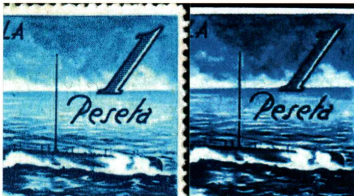
Le scannage à 1'200dpi et comparaison des timbres permet aisément de voir la différence.

Vous l'aurez compris, je cherche les émissions produites aussi bien dans le camp nationaliste que républicain. Si vous avez dans vos stocks de ces émissions ou du courrier de l'époque de mi-juillet 1936 à fin mars 1939, je suis preneur.