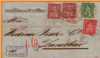
01.06.1876: Handelsbrief von Tragen nach Sansibar, portogerecht frankiert zu 1.35 Fr. bis Sansibar via Genf (2. Juni) und Marseille (3. Juni). Kein Ankunftsstempel von Sansibar.

SCHWEIZERISCHE VEREINIGUNG FÜR POSTGESCHICHTE SOCIÉTÉ SUISSE D'HISTOIRE POSTALE SOCIETÀ SVIZZERA DI STORIA POSTALE